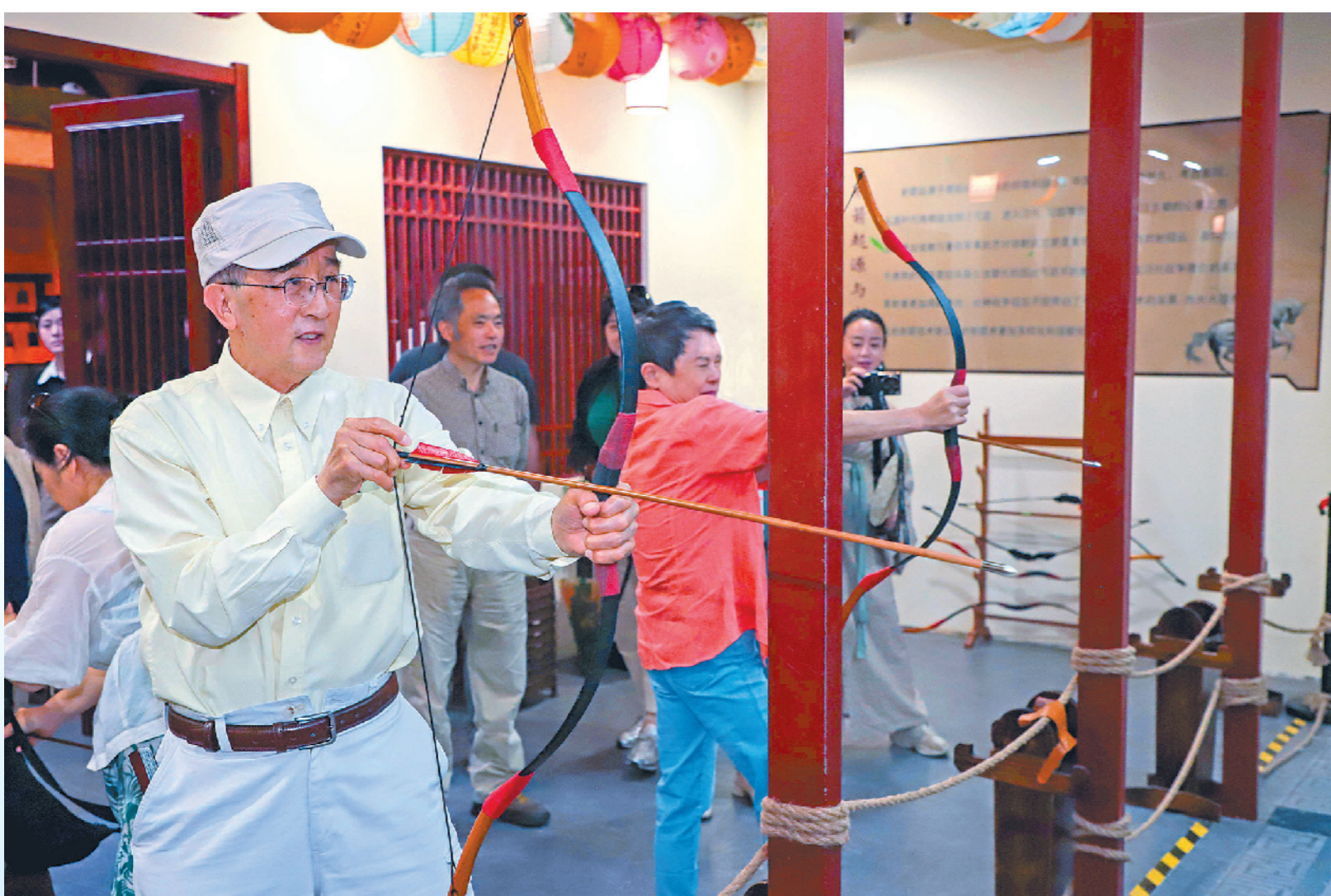
在沛县歌风台尝试射箭。