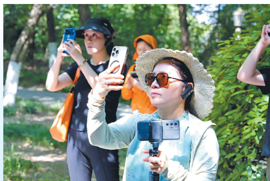
在云龙山欣赏初夏美景。