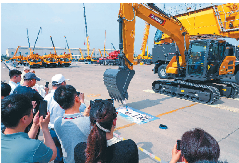
观看徐工集团挖掘机写毛笔字。