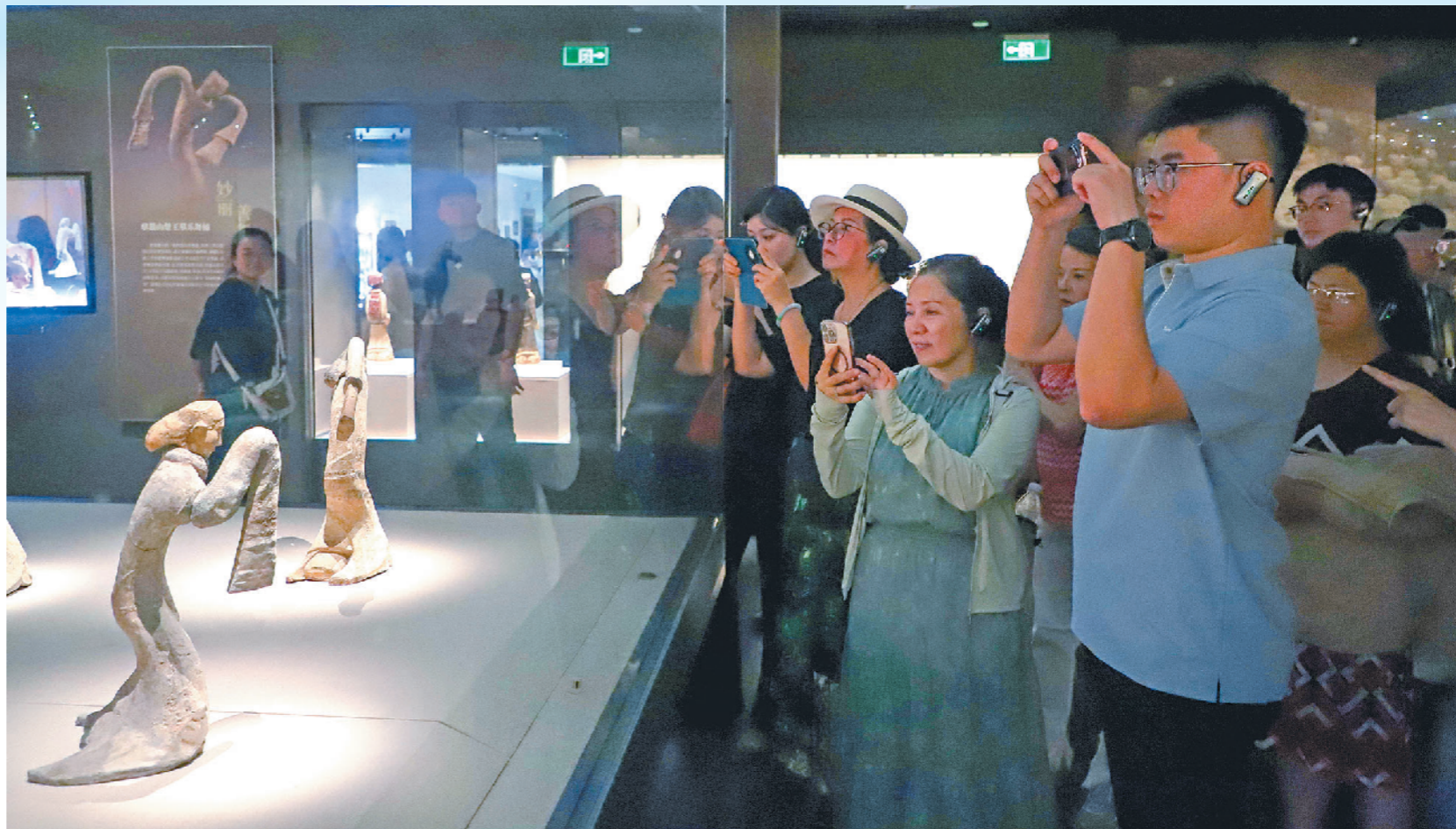
在徐州博物馆参观汉代陶俑。