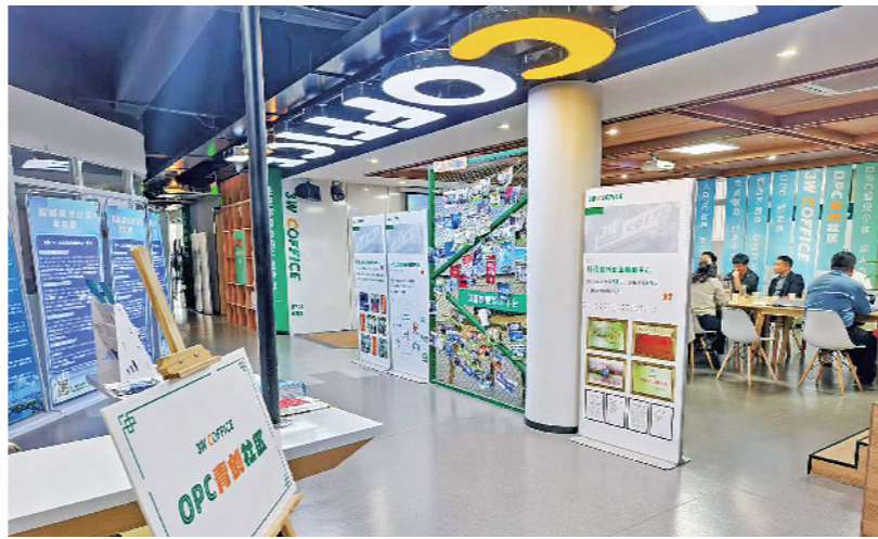
OPC社区的兴起,为创业者提供了低成本办公空间。

从徐州市大学生创业园到淮海科技城,徐州的OPC社区正多点开花。政策的大力扶持,是OPC创业模式在徐州快速发展的重要推力。近年来,徐州出台一系列针对青年创业者的扶持