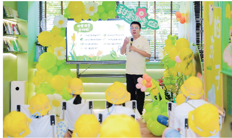
新型公共文化空间既服务儿童研学、青年自习,也满足老人阅读。

新型公共文化空间的“新”,不仅在于其形式的创新,更在于其服务的温度与深度。大型场馆筑牢城市文化根基,微型空间点亮居民日常。新型公