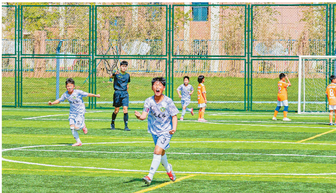
小球员在庆祝进球。

10时40分,第二场比赛在睢宁县睢城实验小学与江苏师范大学附属实验学校小学部之间展开。睢城实验小学的孩子们展现出了强大的实力,配合默契,进攻犀利,最终获胜。