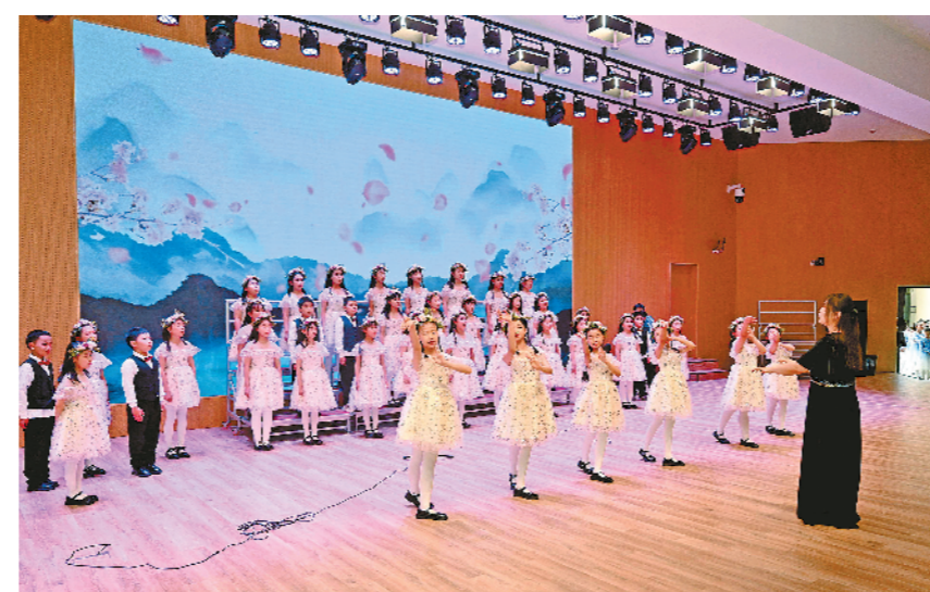
桃园路小学的学生们带来合唱表演。

学清澈的童声合唱《小池》与经十路小学的《心同此愿》《明天》如春风拂过,为这场活力与艺术交织的盛宴画上温暖句号。 “这个活动不是一次‘秀’,而是想把真正优秀的美育作品送到孩子们身边。”活动总导演、江苏模特艺术学校艺术表演系副主任李雪婷告诉记者,这次系列展示共5场,覆盖了泉山区、云龙区、鼓楼区、铜山区和徐州经开区。所有节目都是从去年第八届全国中小学生艺术展演中脱颖而出的获奖作品,“以前我们说‘高雅艺术进校园’,这次是‘身边的优秀节目进校园’,中小学生的节目更容易引起孩子们的共鸣。之后,会争取让更多好节目走进更多校园。” 活动结束后,桃园路小学五年级一位同学兴奋地说:“我最喜欢蹦床和街舞的节目,太帅了!我也想学。”一位带队老师感慨:“孩子们在台上自信发光的样子,就是体育美育最好的答案。不是每个孩子都要成为艺术家,但每个孩子