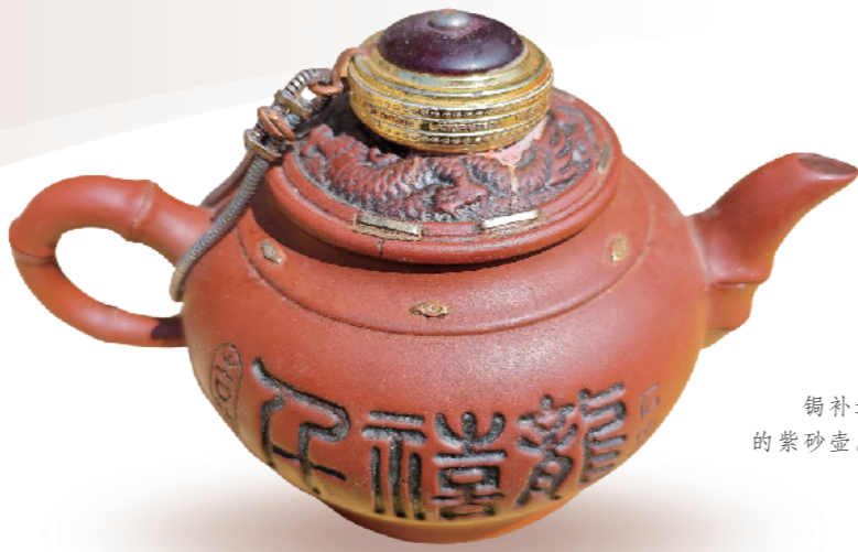
錫补过后的紫砂壶。