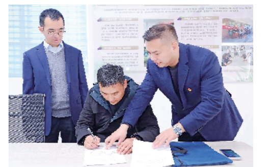
▲签署整村授信。

网点服务提档升级,打造优质服务标杆。全行推进网点“智能+远程”服务模式,柜面通平台实现12家一级支行、72家网点全域覆盖,对公业务远程在线办理覆盖率100%,对公开户迁移率达98%,业务办理效率大幅提升。2025年,成功获评总行五星级网点、省四星级、三星级网点多家,养老金融特色网点建设成效显著,网络金融专业客户满意度达99.3%,系统内排名第二。柜面员工以热情周到的服务、专业高效的能力,为市民提供存款、贷款、理财、缴费、社保卡办理等全方位金融服务,用暖心服务擦亮工行品牌,让市民在每一次业务办理中都能感受到便捷与温暖。