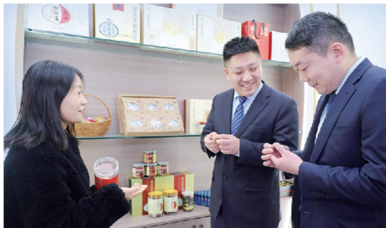
▲走访邳州食品加工企业。