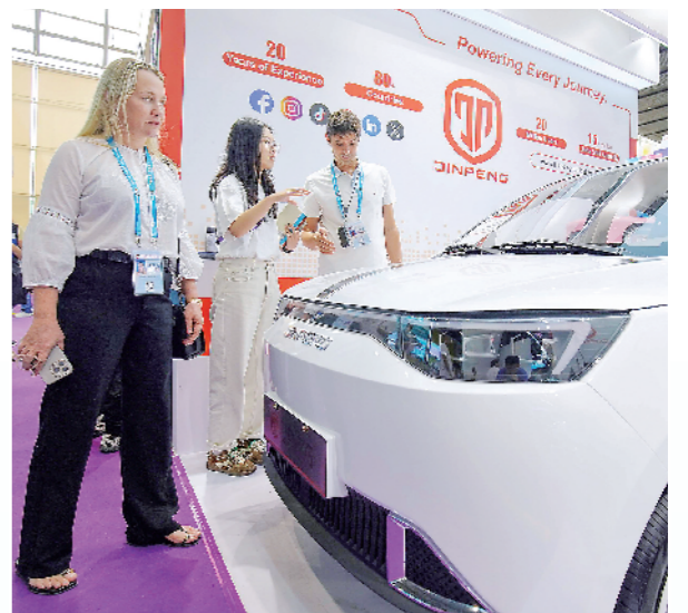
▲金彭集团工作人员向国外客商介绍产品。