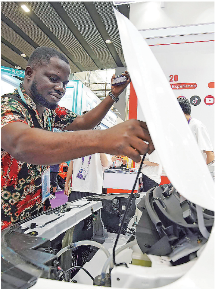
▲国外客商观察金彭集团展示的新能源乘用车内部结构。

本报讯(记者 李薇薇 张雷)4月15日,第139届中国进出口商品交易会(广交会)在广州开幕。