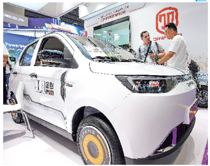
▲金彭集团展示的新能源乘用车,吸引国外客商驻足洽谈。

广交会有“中国第一展”之称。本届广交会展品专区增至179个,首次增设智能穿戴、显示技术、消费级无人机、集成房屋及庭院设施等专区。记者在消费级无人机专区看到,从摄影“天眼”到应急装备、巡检神器,新技术、新场景涌现,展现中国低空经济的创新轨迹。据悉,自1957年创办以来,该展会每年春秋两季在广州举行,是中国目前历史最长、规模最大、商品最全、采购商最多的综合性国际贸易盛会。