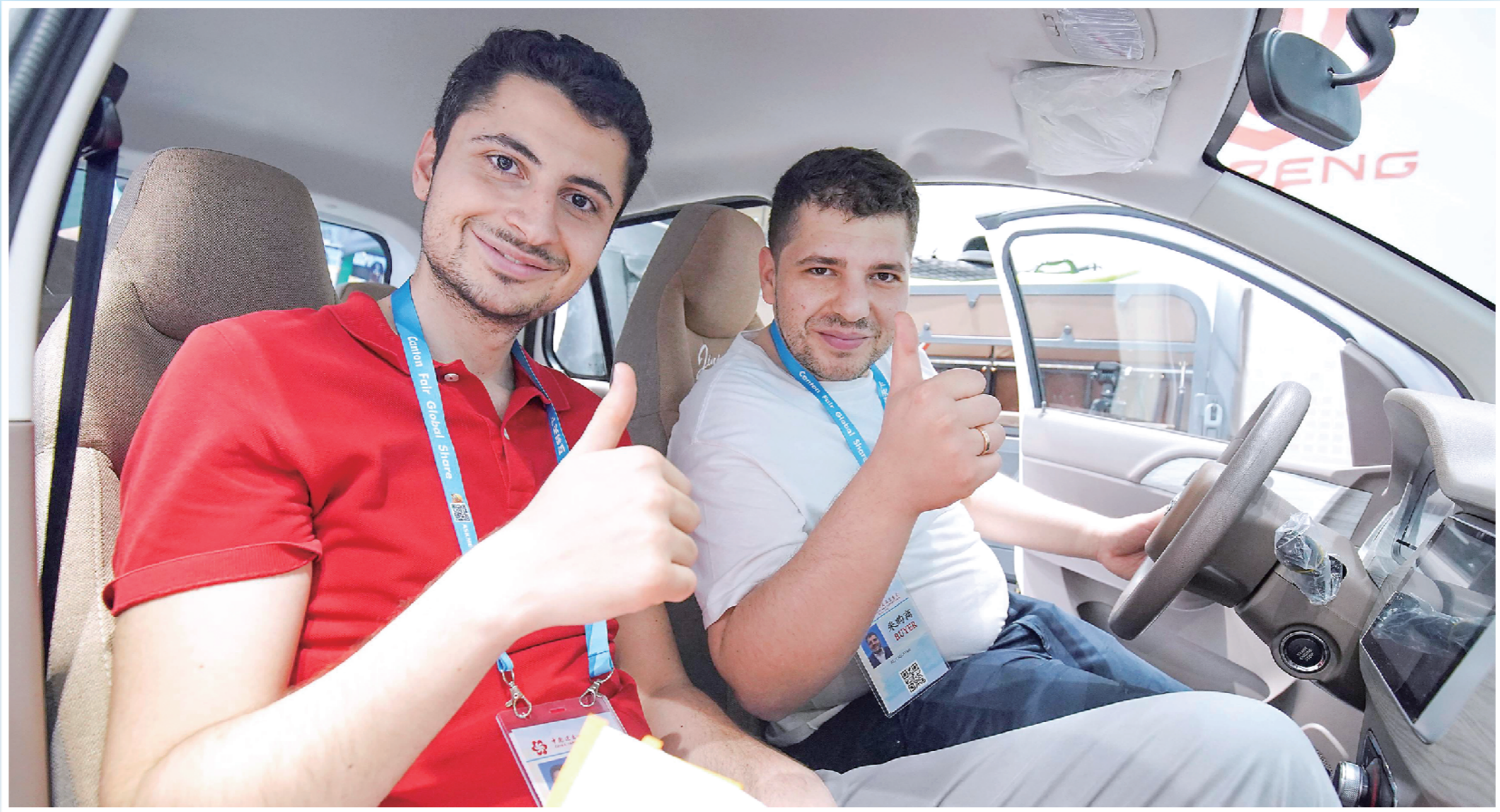
▲金彭集团展示的新能源乘用车，赢得国外客商点赞。