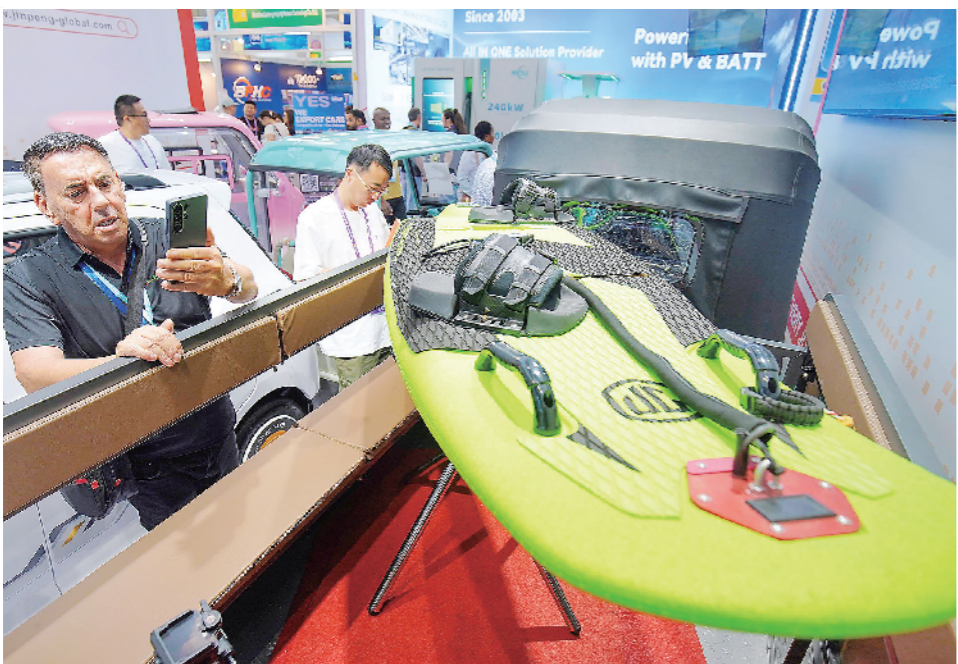
▲在金彭集团展示的电动冲浪板前，国外客商驻足参观拍照。