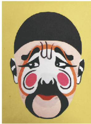
▲套色剪纸作品《脸谱》。