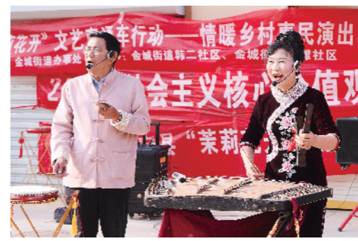
演出现场。