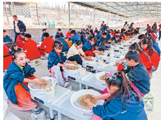
孩子们体验陶艺制作。