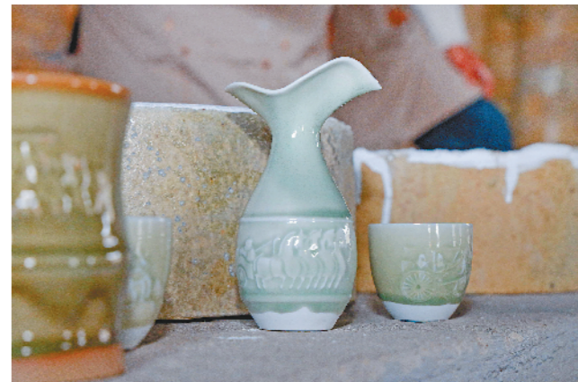
徐州车马出行元素杯盏。