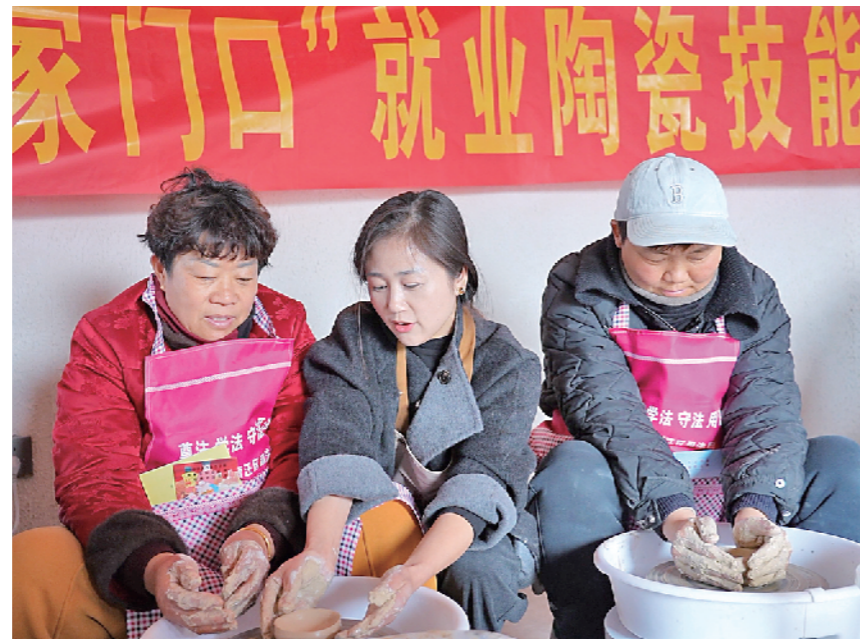
岐山村村民学习陶瓷技能。

化研学平台，目前已逐步成型。”徐道琴介绍，下一步公司将打造“产、学、研、游”一体化模式，进一步拓宽就业渠道，让村民在“家门口”找到合适的工作，实现增收致富。