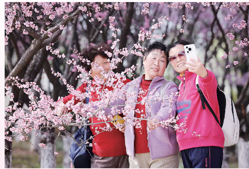
市民在昆仑大道赏花。