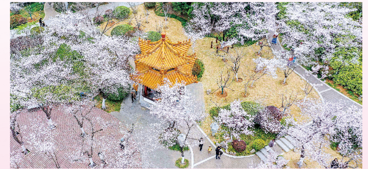
满园樱花如雪云霞。

本报讯(记者 王思恒)春风拂彭城,繁花次第开。近日,徐州市文化广电和旅游局正式推出“且徐行”春季赏花地图,以花为媒,全面整合全市春季赏花资源,为市民、游客打造出行指南。