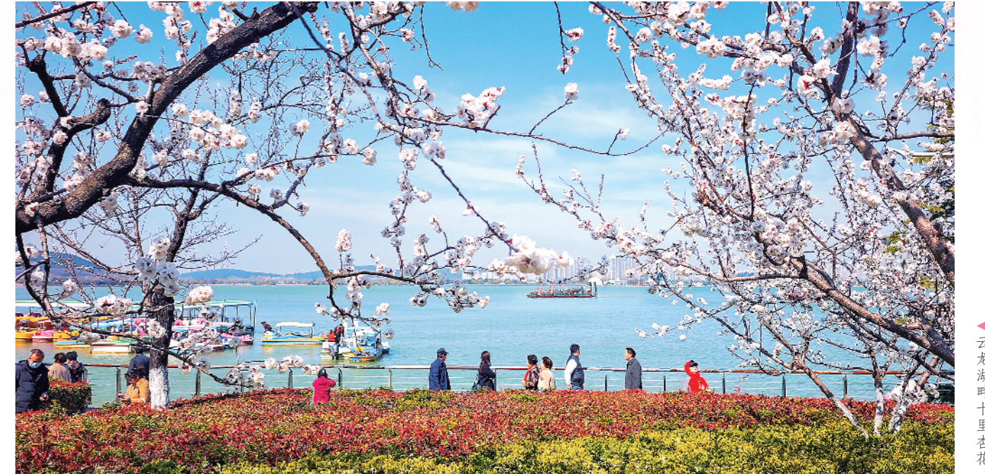
云龙湖畔十里杏花。