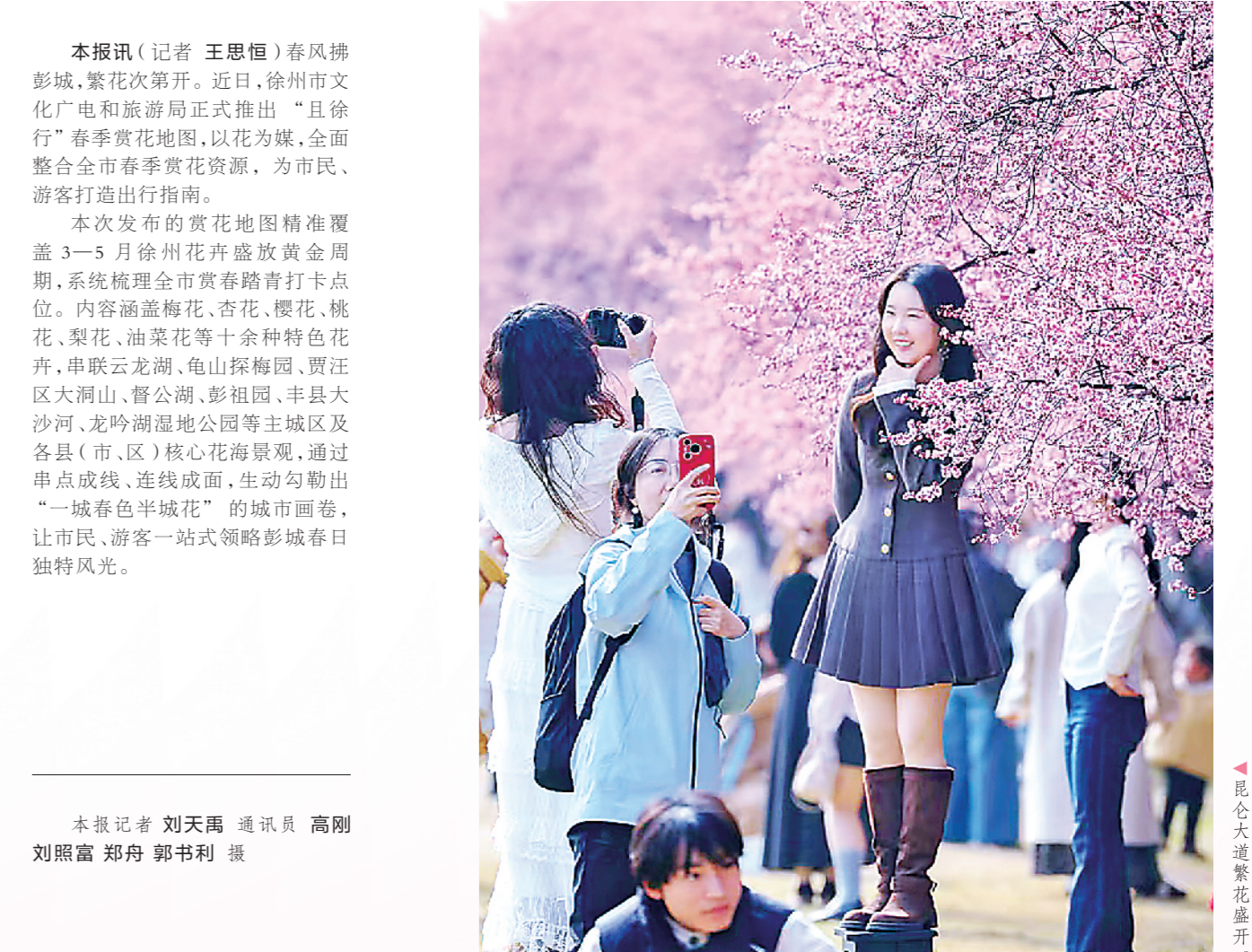
昆仑大道樱花盛开。