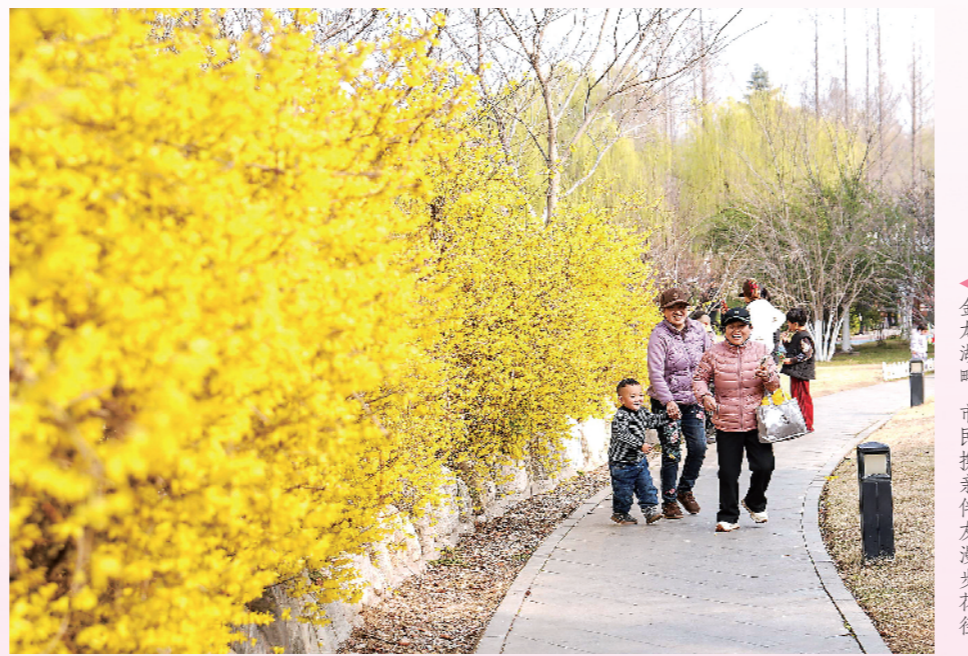
金龙湖畔,市民携家伴友漫步赏樱。