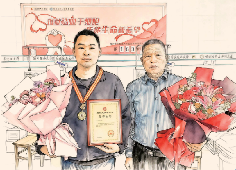
插图依托 AI 绘制