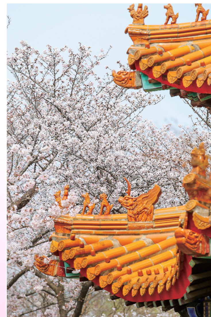
橙瓦与繁花相映,将千年古韵与春日温柔,都揉进这一方晴空里。

春光正好,繁花不候。眼下正值赏花最佳窗口期,满城春色已然铺展,不妨趁着晴好天气,走出家门,赴一场与春日繁花的约会,在彭祖园的樱花海里沉醉,在回龙窝的古巷花香中漫步,沉浸式感受彭城春日独有的浪漫与美好,定格属于这个春天的美好记忆。