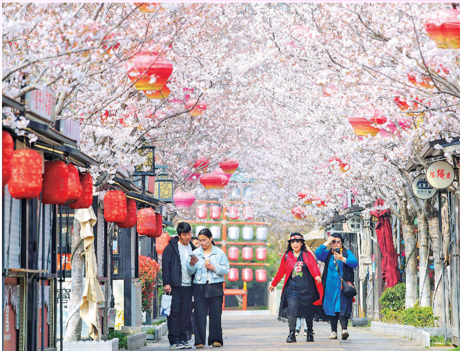
春风拂过回龙窝,樱花如云铺满枝头。