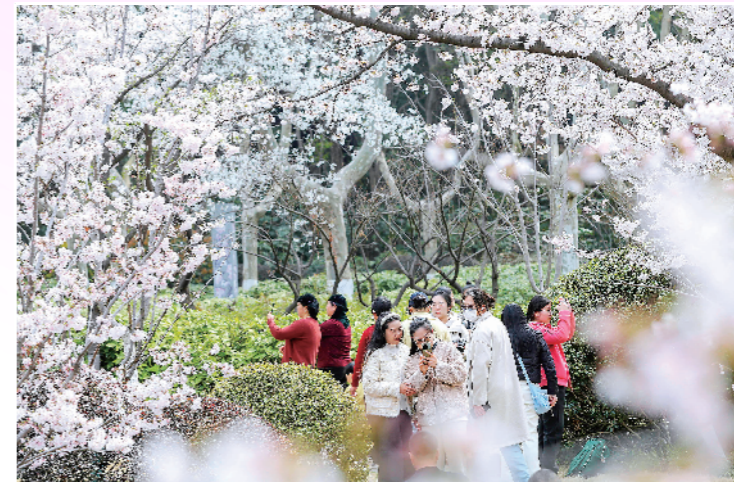
彭祖园里粉白的樱花竞相开放,游人举着手机定格这份春日浪漫。