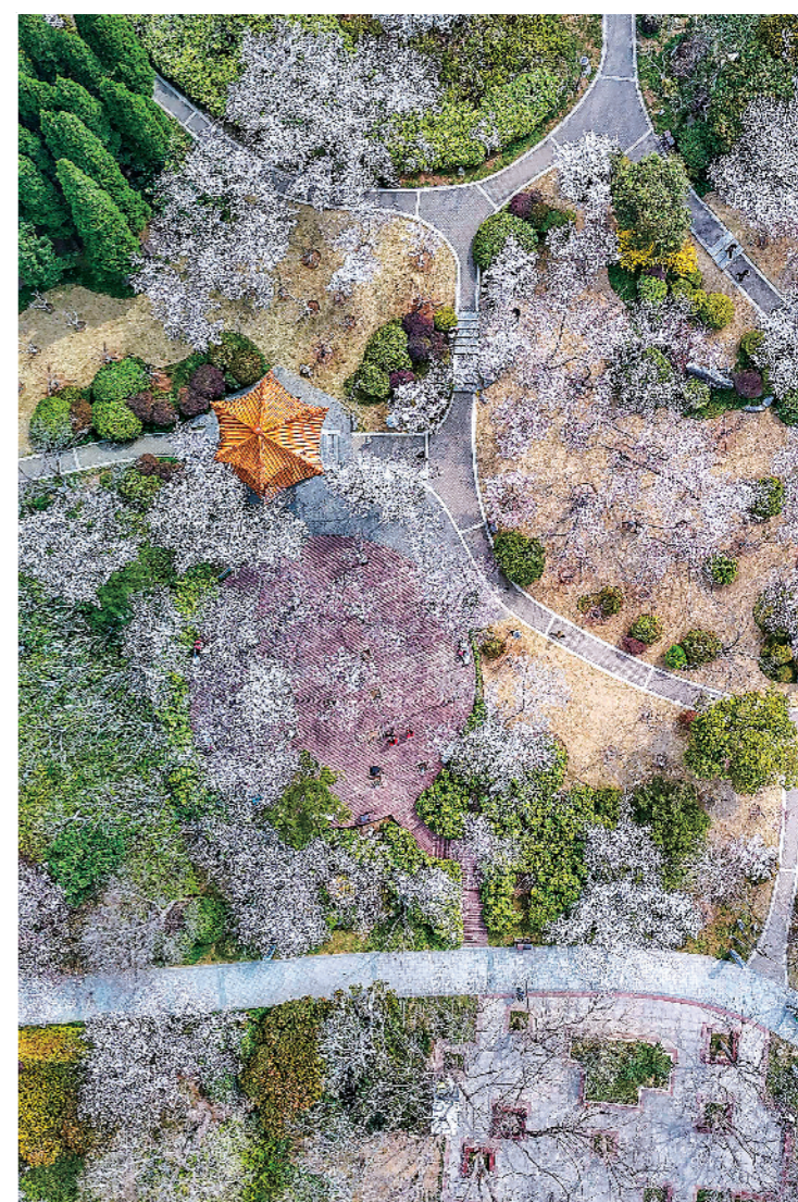
彭祖园里粉白“樱云”交织着蜿蜒步道,橙顶亭阁点缀其间。