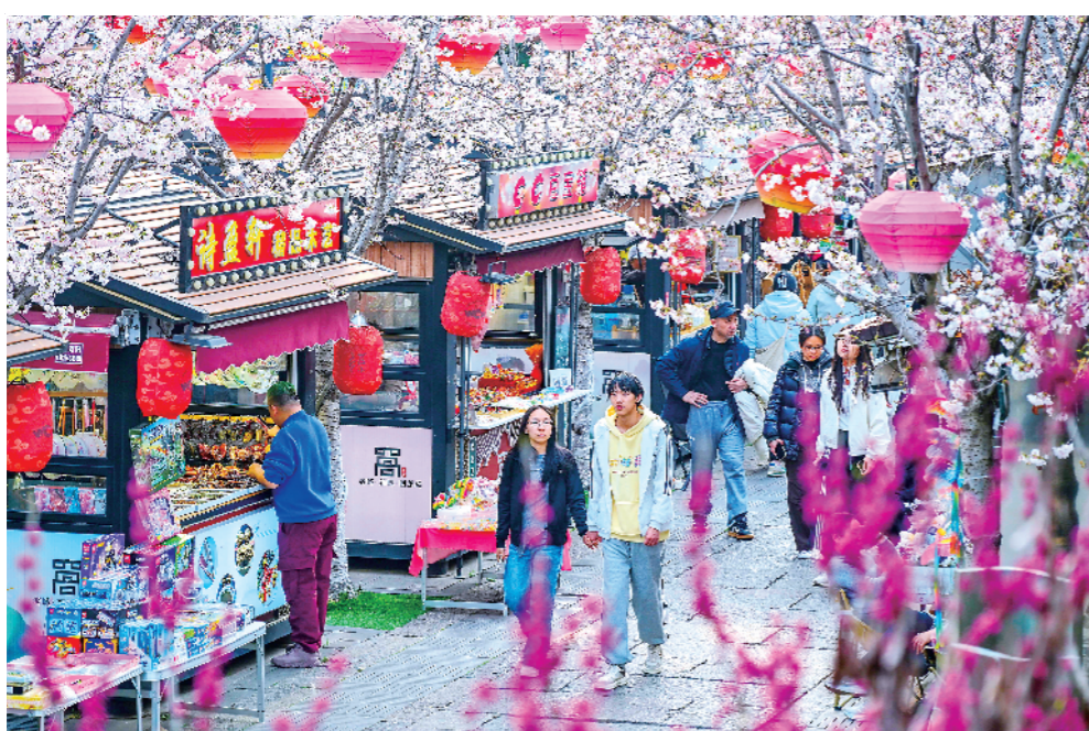
游客漫步在开满樱花的回龙窝历史文化街区中。