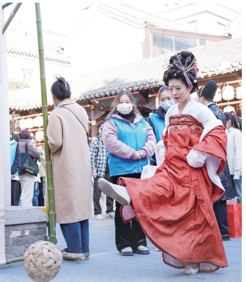
汉文化互动。