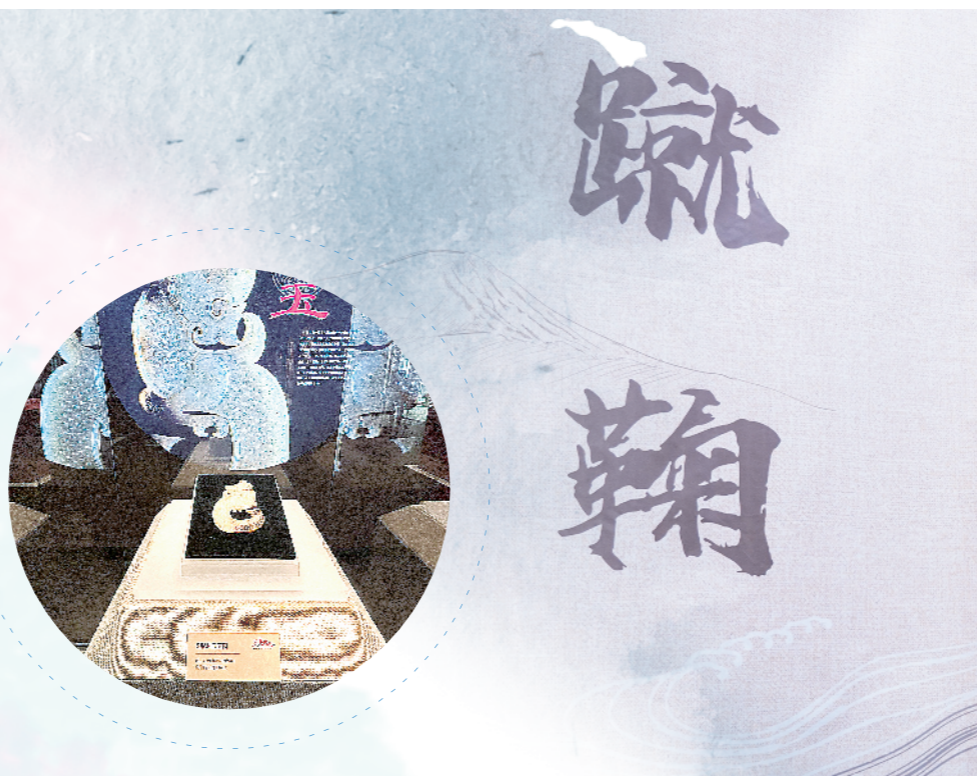
徐州博物馆文物珍宝基展在沛县博物馆开展。