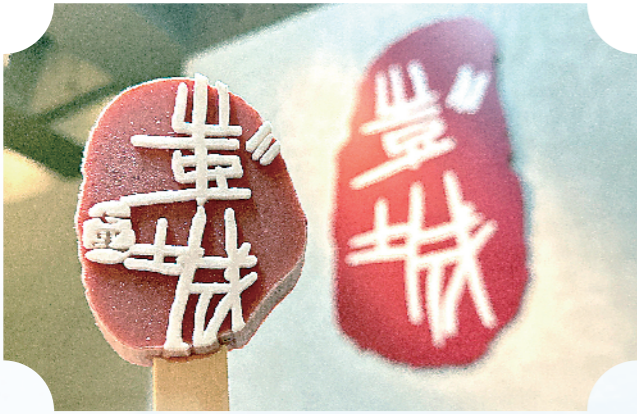
彭城七里文创雪糕。

徐州是汉文化的发祥地。在中华文明史上，徐州汉文化究竟占据着怎样的分量？汉文化的标识性符号应如何提炼？汉文化核心IP的打造又有哪些可行路径？围绕这些问题，专家学者结合研究与实践经验，提出了一系列思路与建议。现整理部分发言，以期为社会提供有益参考。