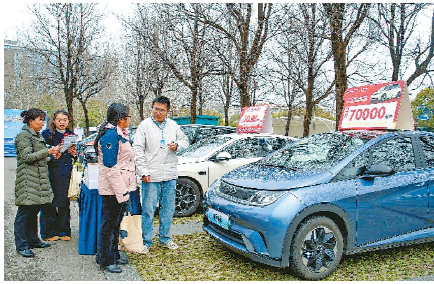
工作人员为职工介绍车型和购车补贴政策。

国家补贴力度十足：报废旧车购买新能源车，按新车销售价的12%补贴，最高补2万元；买燃油车按新车销售价的10%补贴，最高补1.5万元。置换旧车购买新能源车，按新车销售价的8%补贴，