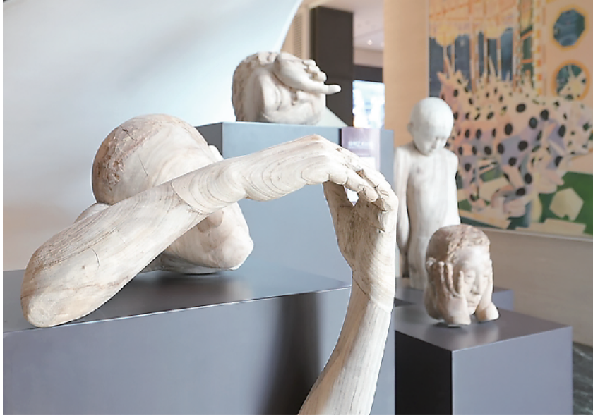
特展上的青年艺术家先锋作品。

艺术馆（美术馆）馆藏精品，涵盖喻继高、朱振庚等国内艺术大师，俄罗斯列宾美院油画院长秋文、法国画家彦那·黑北客等国际名家的经典之作，以及凭借东方机械美学走红的聂士昌等多位毕业于中国美术学院、四川美术学院的优秀青年艺术家的先锋作品，构建起“大师引领—中坚突破—青年创新”的完整艺术生态。展览以“无界”为核心，打破地域与文化壁垒，实现东西方艺术的深度对话；以“先锋”为探索方向，涵盖油画、雕塑、装置、综合材料等多元品类，既推动传统技法的当代转译，又拓展前沿艺术形态；更通过在新盛·未来新七里展厅的立体化陈列，打造沉浸式空间叙事场景，让观众在传统与当代艺术的互文碰撞中，感受美学空