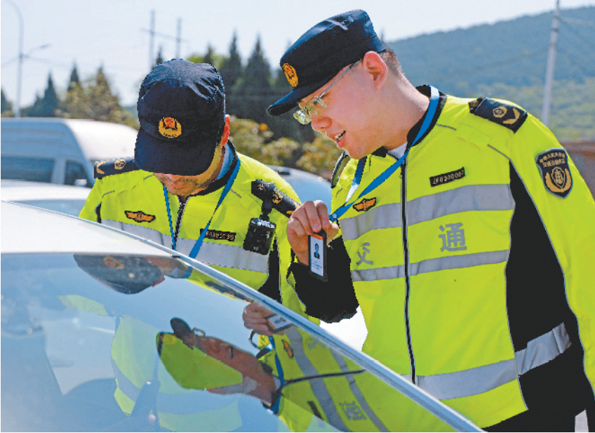
执法人员上路开展执法行动。

地、进车船、进校园、进企业”专项行动,聚焦交通运输从业人员、农民工、中小學生等重点群体,精准提供法律咨询、风险预警、普法宣传等多元化服务,既有力提升了交通运输行业法治化治理水平,也让群众的法治获得感、幸福感不断增强。