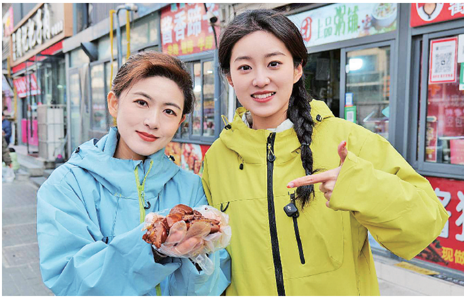
买到了皮糯肉烂的酱香猪蹄。

然而，这些美食只是丰储街的冰山一角。更多隐藏美味静待舌尖解锁。宋记鸡柳外酥里嫩，是学生们的最爱；刘记米线骨汤清亮浓郁，一碗下肚暖意融融；潘记红烧肉肥瘦相间，配米饭简直一绝；夏抱冰冰粉，堪称解腻神器；大楚家枣子糕软糯香甜……店主们日复一日坚守于此，用味道讲述着关于