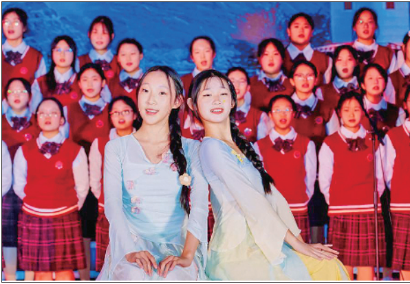
大庙中学师生合唱团荣获徐州经开区师生合唱比赛初高中组第一名。

近年来,大庙中学以“求实鼎新、和谐共进”的办学追求,生动诠释着“办好人民满意的教育”的深刻内涵和时代要求。这里没有浮躁与功利,有的是一份沉静耕耘的坚守与蓬勃生长的力量。学校坚持以“以人为本、以师生发展为本”为核心理念,将厚重的历史积淀转化为砥砺前行精神动能,在“构建师生共同成长的高质量教育生态”的道路上,步履坚实,气象一新。