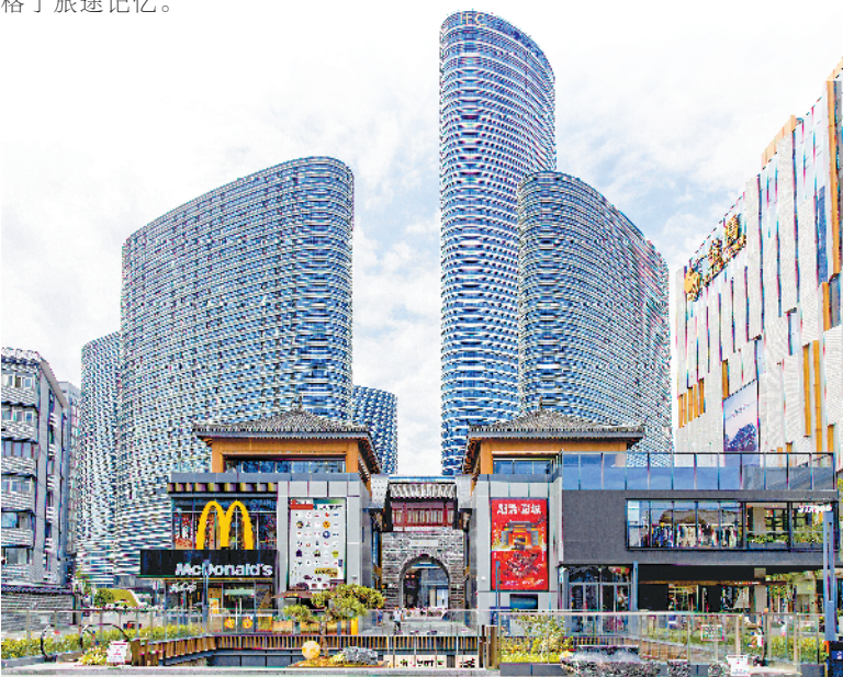
文庙街区紧邻繁华商厦。

“郡列九州雄领严疆带砺，楼高百尺辉曜睥睨海云霞。”在江北第一楼前，一位游客正逐字逐句诵读着墙上的楹联。 “出来游玩，我最爱品读当地建筑上的题字、刻文。”这位游客告诉记者，他叫王隆，山东人，平日喜欢研究传统文化。 “最近我因为出差，在徐州待了些日子，也逛了不少地方，登了云龙山，游览了泉山森林公园。”他感慨道，“我还琢磨着‘鼓楼’在哪儿，问了市民才知道，老鼓楼在时代的发展中已经不存在了，眼前这个复建的‘江北第一楼’，其实就是鼓楼的重现与新生。” 王隆坦言，没想到曾在市中心路过多次的地方，竟然就是自己心心念念的鼓楼。“这座城楼气势恢宏，站在这里能真切感受到历史的厚重。我知道徐州自古是兵家必争之地，这高大的城楼，很符合徐州的城市气质。而且它整体形制典雅规整，让人赏心悦目。” 他还向记者展示了相机中刚拍的照片：除了城楼整体全景，其余皆聚焦文字细节，“中樞巨镇”四字衬着青灰色石砖，尽显古朴雄浑；“江北第一楼”匾额高悬城楼之上，在飞檐斗拱的掩映间，更添几分庄重大气。 “对了，你能帮我拍张照吗，以这个门楼为背景，谢谢啊。”他笑着问记者，记者接过他手中的相机，对准江北第一楼的雄姿与他的身影，为王隆定格了旅途记忆。