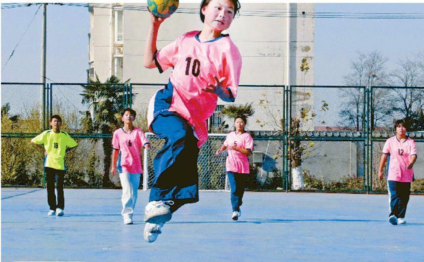
学生们在球训练中。