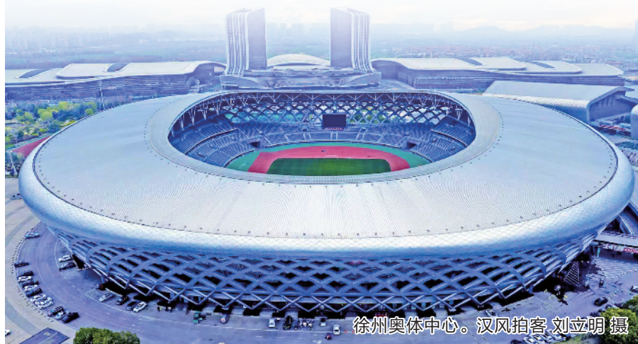
徐州奥体中心。

5月9日晚，“苏超”的哨声会准时响起。而在此之前，这位“数字指挥官”已经为每一名球迷、每一辆车、每一个需要帮助的人，提前算好了最安全的路线、最温暖的抵达方式。