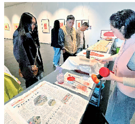
观众近距离感受非遗拓印技艺。