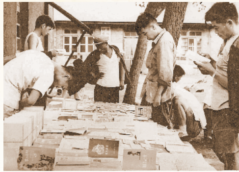
徐州街头的流动书摊。图书管理员在整理图书。