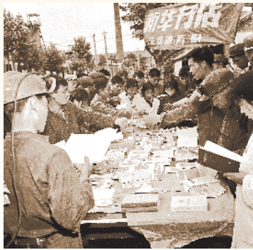
新华书店的送书下乡活动。

除了书店，徐州街头还散落着不少书摊，多设在巷口、娱乐场所门前，集市与庙会上也有旧书交易。抗战时期，战火侵袭令本地书业备受冲击，日伪当局开设的一些宣传性书店，更是扰乱了行业的健康生态。到徐州解放时，徐州市内有中华书局、文明书局、开明书店、大众书店等20余家。