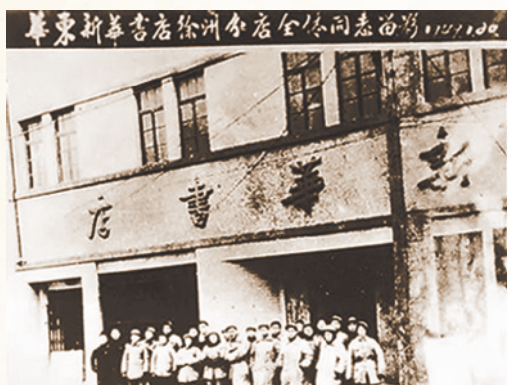
新华书店承载着几代人的阅读记忆。

徐州市档案馆珍藏着一些资料与老照片，还原了徐州人曾经的阅读日常。图书馆、工厂、校园里，读书看报蔚然成风，市民在条件简朴下依旧从字里行间汲取力量。岁月流转，阅读始终滋养着这座城市，让书香在时光里绵延。