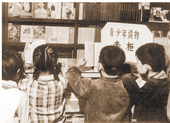
书店里的青少年读物专柜总是围满了小朋友。

为满足儿童阅读需求，市图书馆专门设立了儿童借阅室，只是空间有限，早期面积仅约60平方米。1982年，该借阅室独立为徐州市少年儿童图书馆，面积增至近300平方米，馆藏图书也达到4万余册。