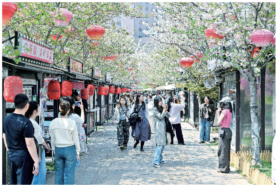
游客游览回龙窝。