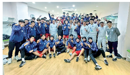
徐州队赛后在更衣室合影。

江苏师范大学深耕高水平足球运动多年,2024年成为教育部批准的全国首批开办足球运动专业的高校之一,并获评江苏省品牌专业。学校足球学院构建起从教学、训练到竞赛的完整体系,培养出一批批技术扎实、意志过硬的学生运动员。去年,校男足、女足在“省长杯”大学生联赛中双双以全胜战绩夺冠,校女足更是在近六届省运会中四次登顶,多次以零失球战绩捧杯。依靠这些校园足球底蕴,为“苏超”徐州队输送了众多优秀的球员。