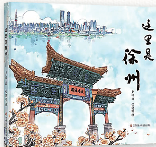
城市文化绘本《这里是徐州》。