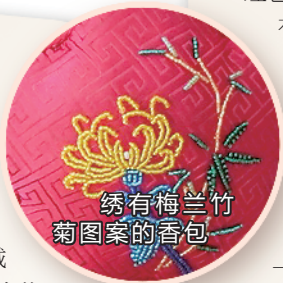
绣有梅兰竹菊图案的香包

里荷花繁茂，盛开如海，心中十分期待，就一起制作了一款荷花香包。希望大家都能在花香中，享受生活的美好。”