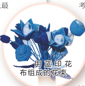
用蓝印花布组成的花束