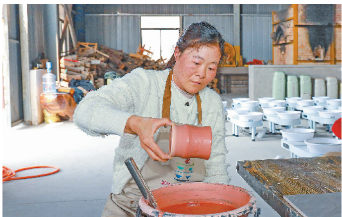
采用浸釉法让坯体均匀挂釉。