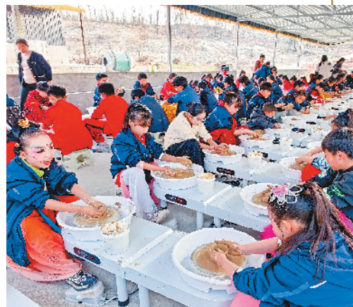
孩子们体验陶艺制作。