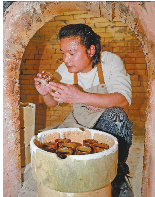
仔细检查每件器物。