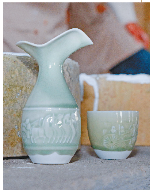
徐州车马出行元素杯盖。

窑火不熄,传承不止。在岐山村,这团窑火不仅烧出精美陶艺,更照亮了乡村振兴的致富路,一幅产业兴、乡村美、百姓富的画卷正徐徐展开,越绘越精彩。