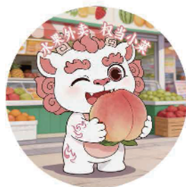
对阵南京队(盐水鸭)