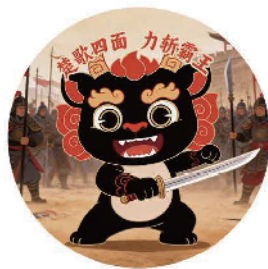
对阵宿迁队(楚霸王)