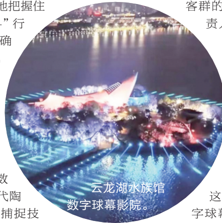
云龙湖水族馆数字球幕影院。

当前，徐州提出“创新打造消费场景”，而数字化正在为文旅体商融合提供坚实支撑。未来，随着彭城七里、《彭城风华》等城市文化名片的溢出效应被进一步放大，一个“线上虚拟漫游+线下深度体验”的“AI漫游徐州”文旅智能体，将从蓝图走向现实。