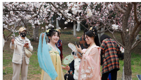
身着汉服的游客前来游玩赏花。