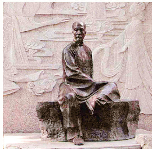
杭州五洋公园里的洪昇雕塑。