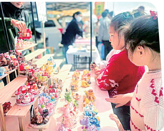
▶▲2026湖畔有好市之大龙湖风筝文化集，烟火气十足。