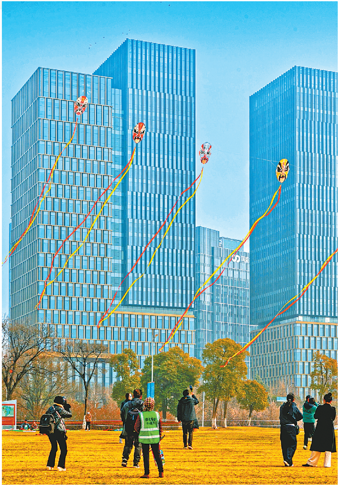
放飞京剧脸谱风筝。

面对孩子们的提问，徐州市风筝运动协会的老师们立刻化身和蔼的“民俗讲师”。他们蹲下身子，耐心地向孩子们讲述“二月初二，龙抬头”的传统习俗，讲解风筝的起源、种类和飞行原理——从古代的风鸢讲到现代的工艺风筝，从驱邪祈福的传说讲到体育健身的演变……在这片开阔的草坪上，传统文化的种子悄然播撒进孩子们的心田。