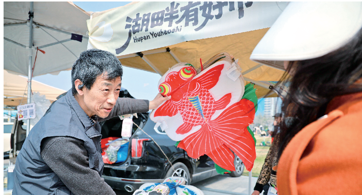
市民在风筝文化集选购风筝。