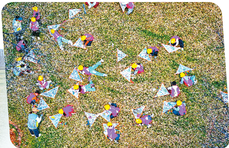
孩子们在风筝上作画。