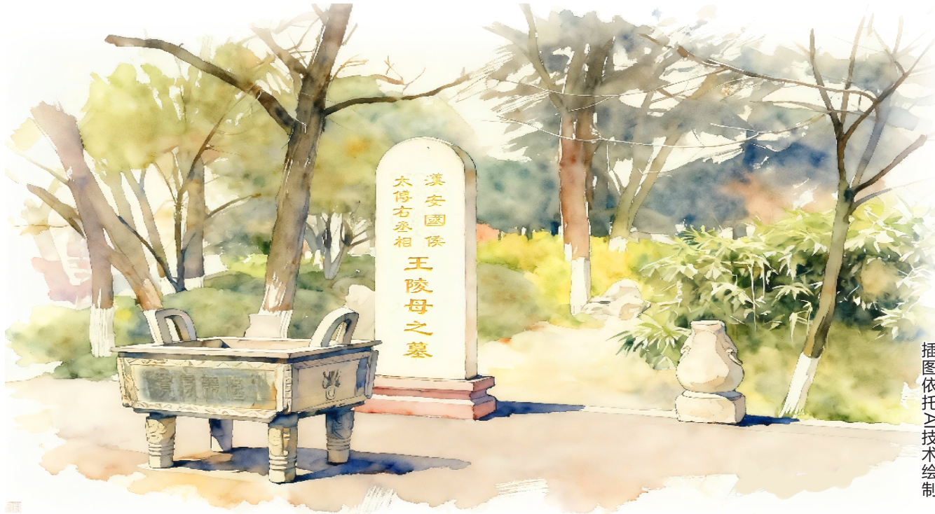
插图依托AI技术绘制

“彭城七里AI颂”欢迎每一位感兴趣的你，一起来“颂一颂”，为彭城七里“颂”出精彩！