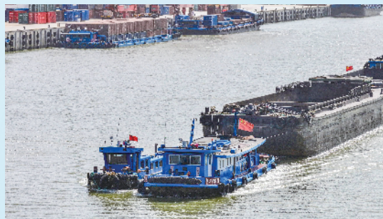
徐州港双楼作业区集装箱码头,运输车辆川流不息。