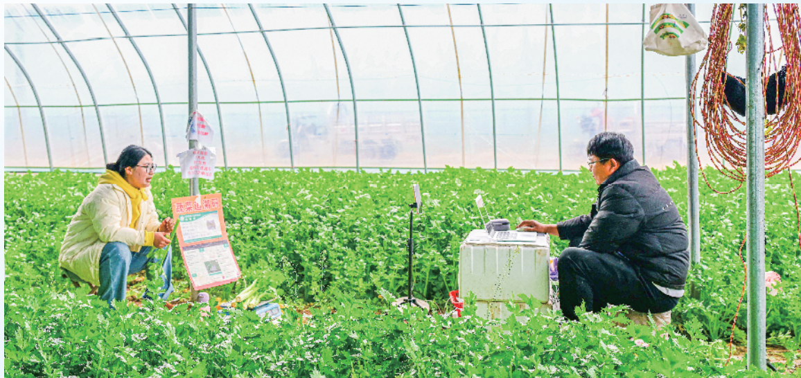
铜山区黄集镇郅城村的蔬菜大棚内,年轻人正忙得不可开交,手机变为“新农具”,大棚变成“直播间”。