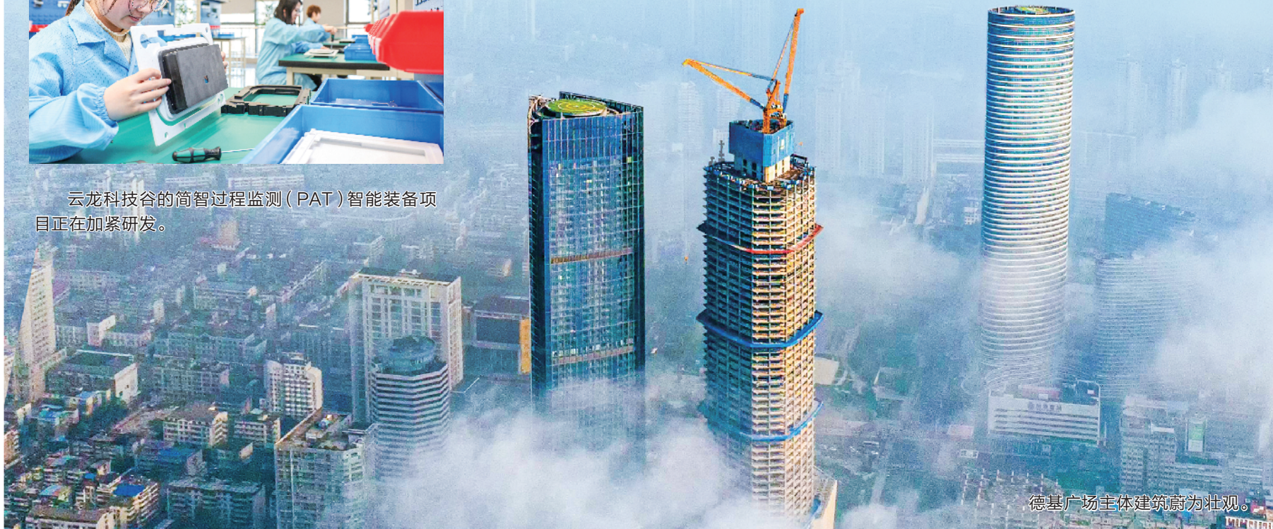
德基广场主体建筑蔚为壮观。