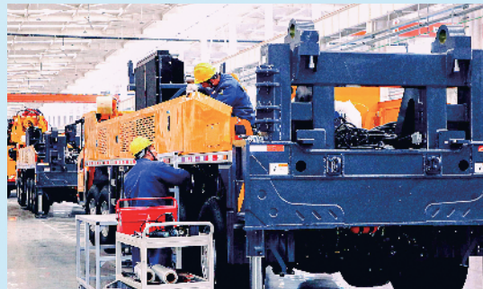
徐工基础工程机械智能制造基地车间内,各条生产线紧张有序地忙碌着。