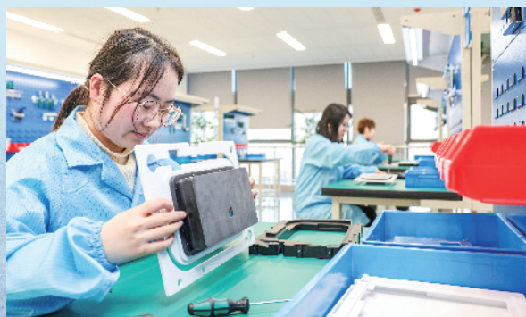
云龙科技谷的简智过程监测(PAT)智能装备项目正在加紧研发。