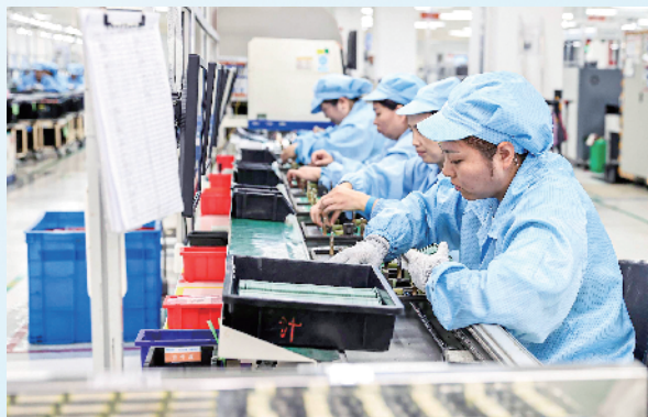
位于徐州高新区的江苏省精创电气股份有限公司的生产车间内,工人们忙生产,赶订单。