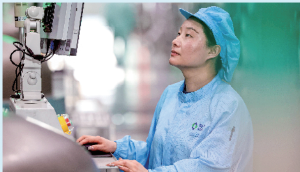
在江苏协鑫硅材料科技发展有限公司生产车间内,工人全神贯注忙生产。