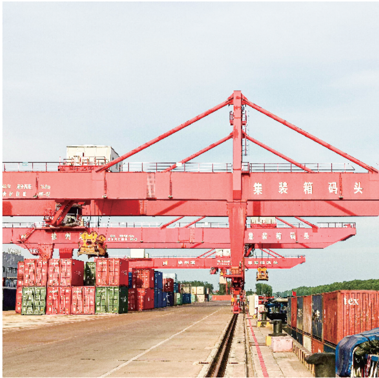
徐州双楼国际集装箱码头。