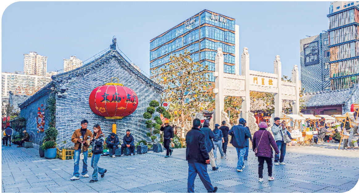
文庙街区人流熙攘。

“这里还有关于传统文化的展陈，在寸土寸金的商业中心地带，能给文化和教育留一些空间，真的很难得。”她一边说一边随手发布了这段视频，“这种古今交融之感，让徐州更添魅力。”