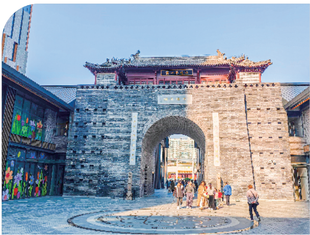
站在“江北第一楼”前，感受历史的厚重。

云龙湖的秀丽风景、徐州博物馆的汉代文物、户部山的古色古香……徐州热门景区众多。而地处市中心、紧邻繁华商厦的文庙街区，更是凭借独特魅力引人注目，成为游客来徐州的打卡地。它的吸引力究竟何在？记者走近多位在此驻足留影的游客，倾听他们对这片街区的感受。