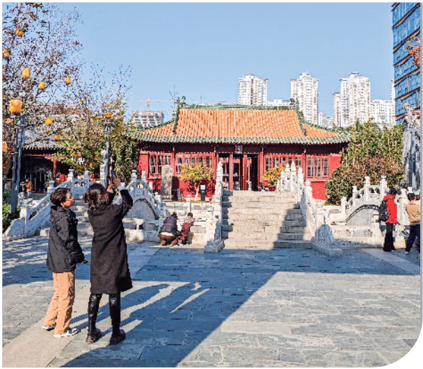
古色古香的文庙吸引游客驻足拍照打卡。