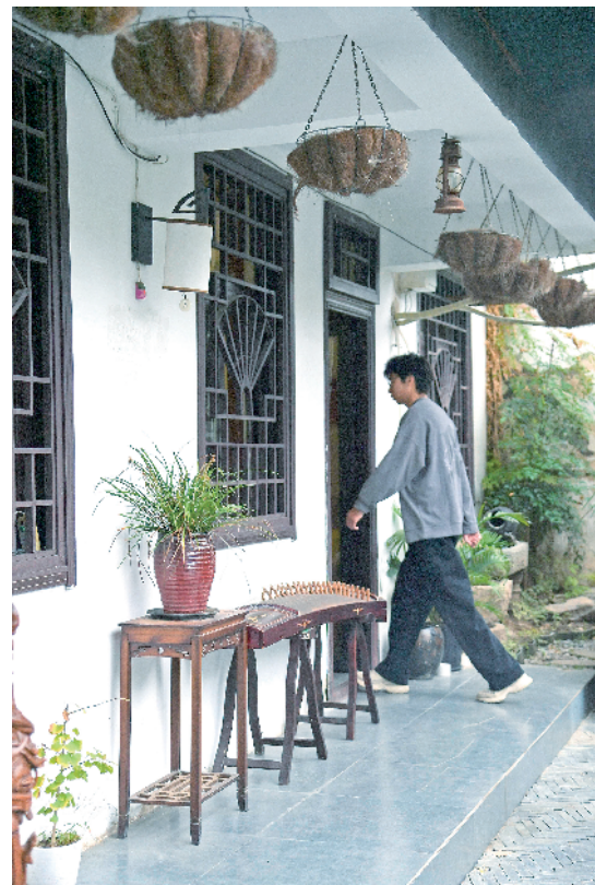
“静尚驿站”小院环境。

这些细小的安排,让很多人住者心里暖暖的:“这不像临时住处,更像一个陌生人给我们准备的家。”