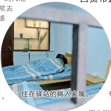
住在驿站的病人家属。

今年9月,朋友的父亲住院,他又一次走进病房。尽管医院提供了多种过夜方式,但陪护人员的辛酸依旧让人动容。那天晚上,他