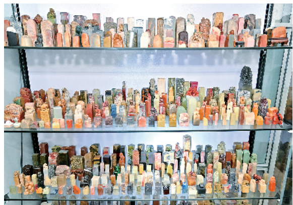
收藏的各式印章原石。

他曾为了128方秦汉古印，毫不犹豫地低价卖掉了自己的房子。这份在旁人看来近乎疯狂的执念，于他，却如同名士张伯驹为护国宝《平复帖》而散尽家财，是一种对“庸俗现实”的主动舍弃，和对文化血脉的坚定守护。在他眼中，那些斑驳陆离的古印，“不啻钟王法帖”，方寸之间，凝结着古人在书法、构图、线条上的全部智慧，构成一个宏大而精深的审美世界。