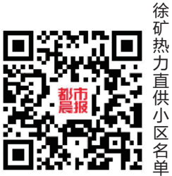
徐矿热力直供小区名单

司、徐州润源热力有限公司、徐州润新热力有限公司、徐州南区热电有限责任公司4家公司。目前各直供小区均已具备供暖条件，且东区和北区已全部完成注水，并陆续开始升温，确保居民21日零时能够用上暖。同时，应急抢修队伍以及应急物资的准备工作也已完成，出现问题时能够及时响应和处理，保障老百姓正常供暖。