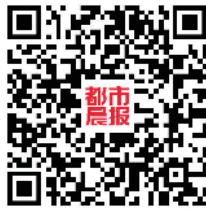
华润热力直供小区名单